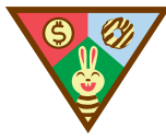
Mis clientes de galletas