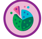
Colaboradora de galletas