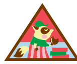
Tomadora de decisiones sobre galletas