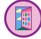
Mi equipo galletero