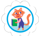
Fijadora de metas de galletas