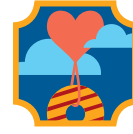
Mi currículum de negocio de galletas