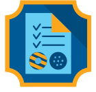
Influencer de galletas