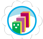
Mi primer negocio de galletas

*Por el momento, sólo las insignias Brownie y Daisy están disponibles en formato bilingüe.